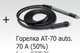
Горелка AT-70 auto. 70 А (50%) 6 м - 037526 12 м - 037533