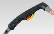
Ручная Горелка МТ-70 70А (50%) 6 м - 037502 12 м - 037519