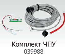
Комплект ЧПУ 039988

Для использования на столе для плазменной резки: