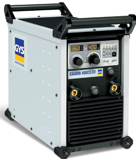
Поставляется без аксессуаров